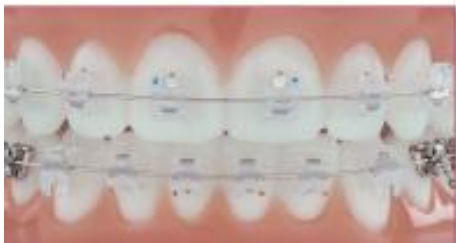
Экспириенс Керамик с эстетической дугой